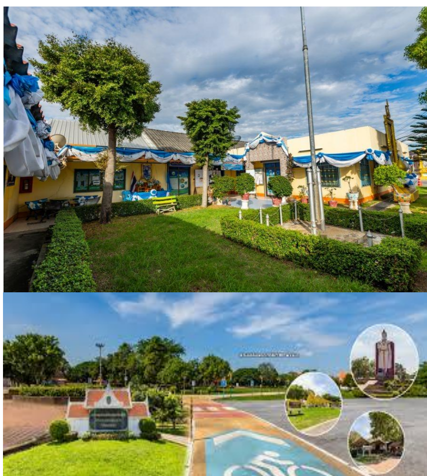
รูปที่ 2.1 องค์การบริหารส่วนตำบลหันตรา จังหวัดพระนครศรีอยุธยา ที่มา : องค์การบริหารส่วนตำบลหันตรา, 2568

แห่ง มีสถานประกอบการตาม พระราชบัญญัติสาธารณสุข จำนวน 167 แห่ง มีหอพัก หรือบ้านเช่า จำนวน 71 แห่ง และสถานประกอบการอื่นๆ อีกทั้งมีสถานที่ท่องเที่ยวที่สำคัญหลายแห่ง อาทิ อนุสรณ์สถานแห่งความรักภักดี (ทุ่งหันตรา) วัดมเหยงคณ์ วัดหันตรา มีตลาดกลางเพื่อการเกษตร ที่มีที่ตั้งอยู่ริมถนนสายเอเชีย เป็นตลาดที่ขายสินค้าทางการเกษตร เช่น กุ้ง ปลา ฯลฯ รวมทั้งผลิตภัณฑ์ของใช้สินค้าพื้นบ้านจากที่ต่างๆ ทำให้เป็นสถานที่ท่องเที่ยว เป็นที่แวะซื้อของคน ที่ผ่าน ไปมาสร้างรายได้ให้คนในชุมชน และคนนอกพื้นที่ ปัจจุบันองค์การบริหารส่วนจังหวัด พระนครศรีอยุธยาเป็นผู้บริหารจัดการ ถือเป็นแหล่งท่องเที่ยวที่สำคัญของจังหวัดและตำบลหันตรา