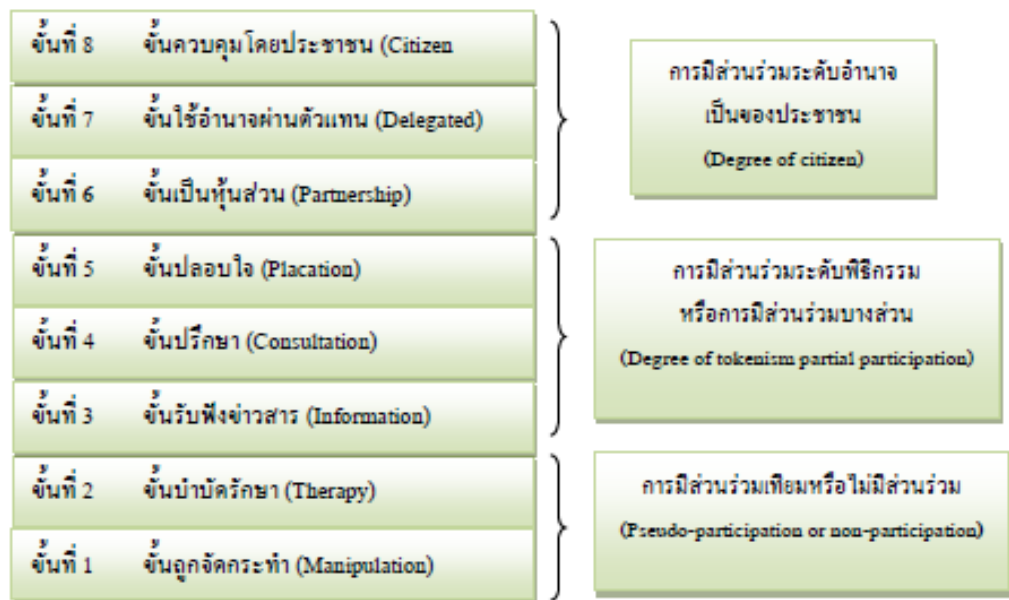
ภาพที่ 2-2 การมีส่วนร่วม 8 ขั้น ของ Arnstein (1969)

Arnstein (1969) ได้แบ่งการมีส่วนร่วมของประชาชนมีลักษณะเป็นขั้นบันได (Participation leader) 8 ขั้น ดังภาพประกอบ ดังต่อไปนี้